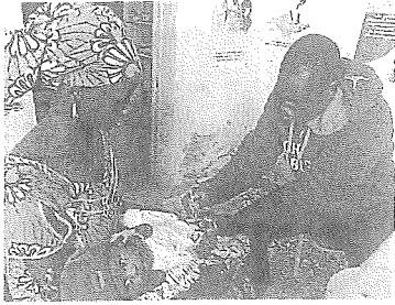
120 enfants voient le jour chaque année dans la maternité.

Les Amis de Diawar lance un appel pour financer les travaux de la maternité du village sénégalais, que l'association aide depuis plus de vingt-cinq ans. 2 700 € sont nécessaires.